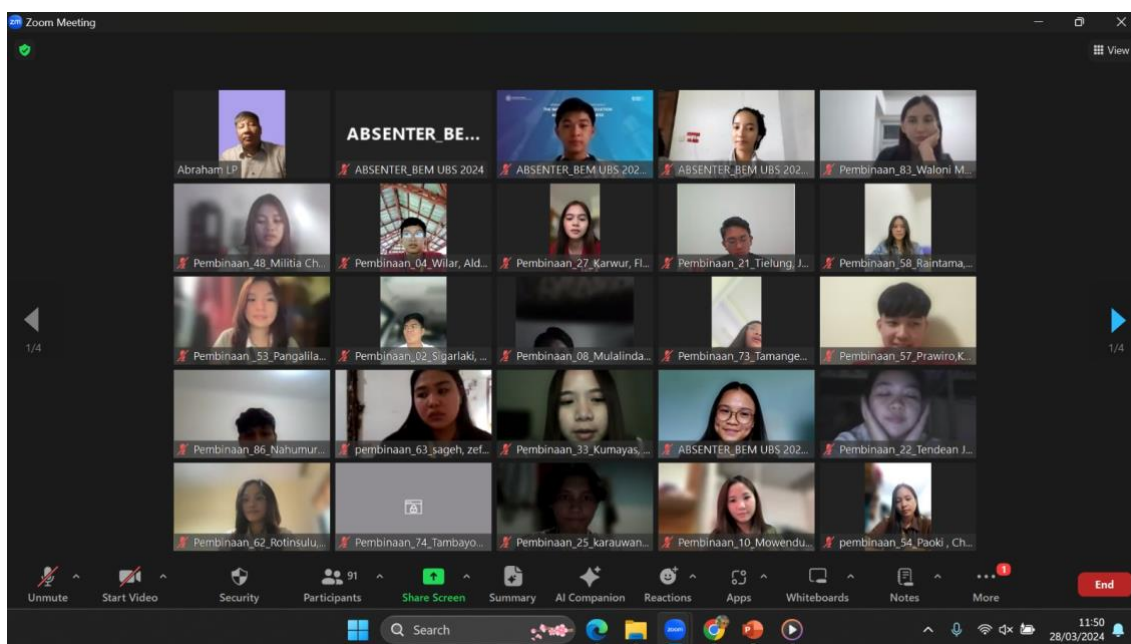
Gambar 2 Kegiatan webinar